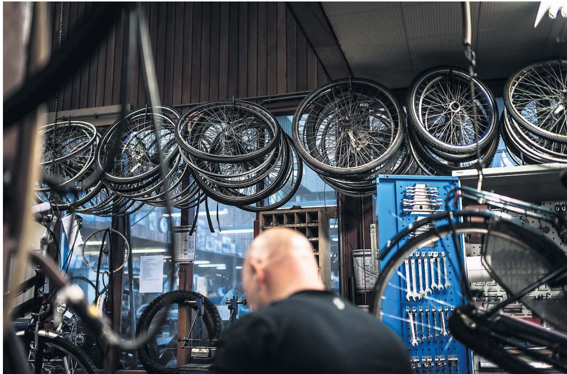
▲ In de werkzaal metaal hangt een muffe lucht van metaal, vuur en stof.